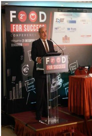
Η ομιλία του Αναπληρωτή Υπουργού Αγροτικής Ανάπτυξης και Τροφίμων στο συνέδριο του «2nd FOOD and SUCCESS CONFERENCE 2015»

Συνέργειες και σχεδιασμός για την προώθηση πιστοποιημένων ποιοτικών προϊόντων στις διεθνείς αγορές.